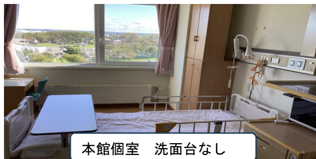
本館個室 洗面台なし