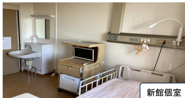
新館個室 洗面台・シャワー室付き