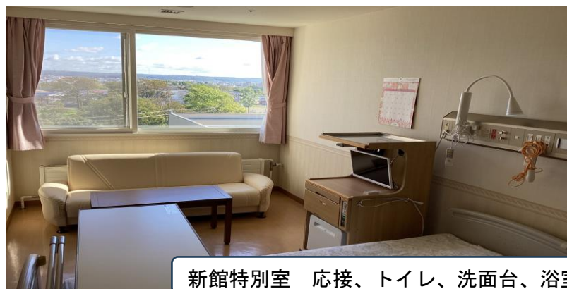
新館特別室 応接、トイレ、洗面台、浴室付き