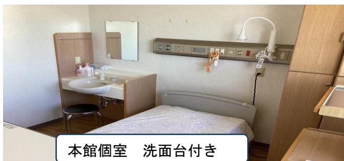
本館個室 洗面台付き