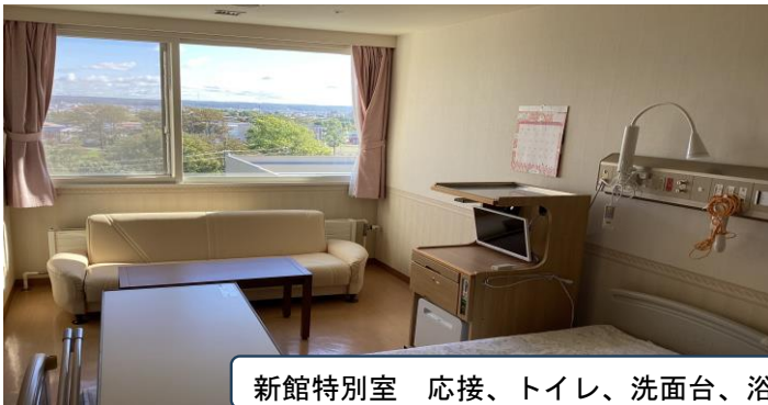
新館特別室 応接、トイレ、洗面台、浴室付き