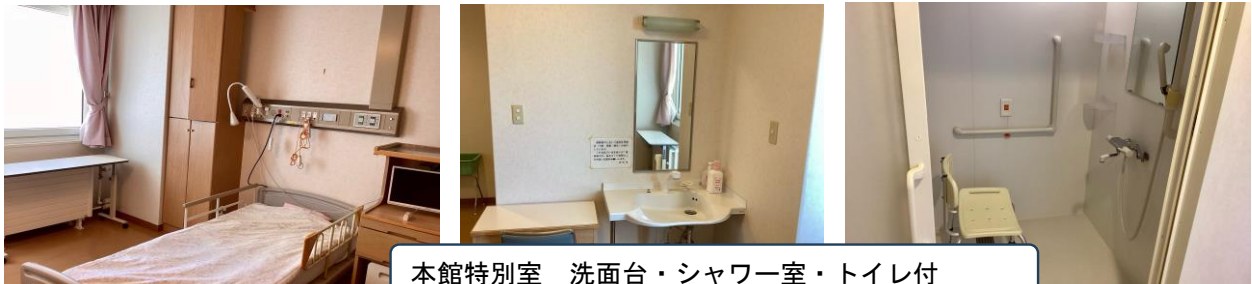
本館特別室 洗面台・シャワー室・トイレ付