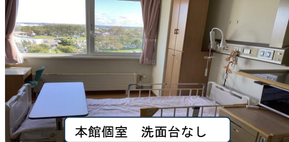
本館個室 洗面台なし