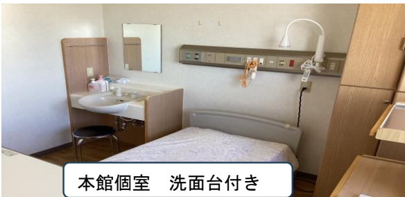
本館個室 洗面台付き