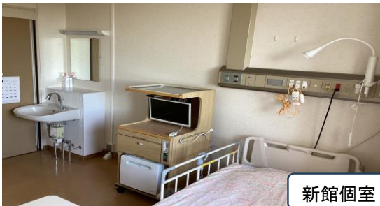
新館個室 洗面台・シャワー室付き